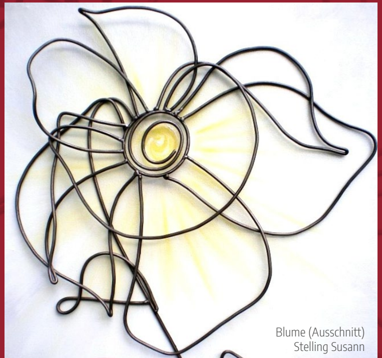
Blume (Ausschnitt) Stelling Susann

26. Kunstparcours Schönecken / Eifel Mai bis Oktober 2019