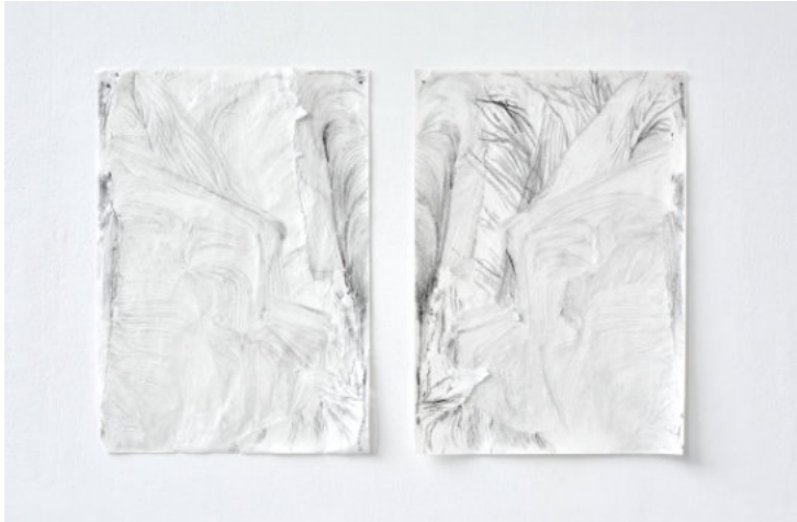
Leonie Mertes, ohne Titel, 2020, Graphit in Papier, gespalten, je 59,4 × 42,0 cm, Foto: Celine Gieseler

Nächste Ausstellungen vom 30.07. – 03.09.2023 mit Künstler*innen aus RLP und aus der Wallonie. Info-Tel.: 06553-3389.