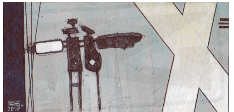
Roland Groteclaes, THEO & MILLA, Mixed Media, 10 × 19 cm