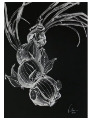
Carla Windhausen, Zwiebelfisch, Scraperboard, 50 × 40 cm