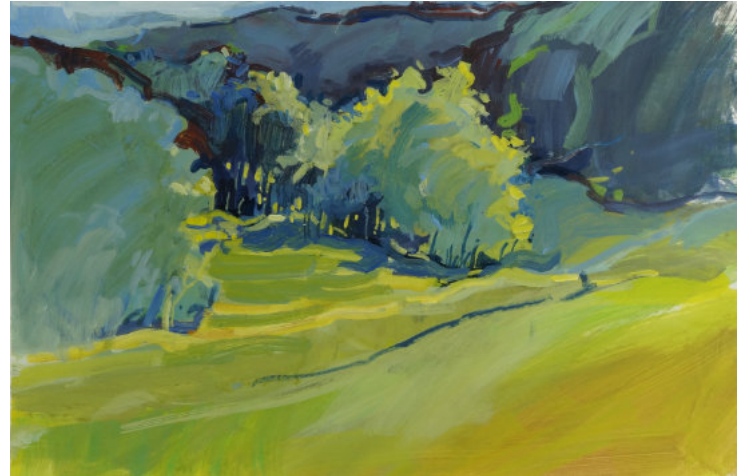
Albrecht Wien, Gladbach, 2020, Malkarton, 31 × 47 cm