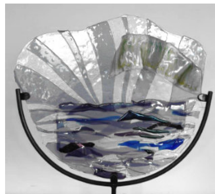
Ellen Welten-Louwers, Nordlicht 5, Glas, im Ofen gefused