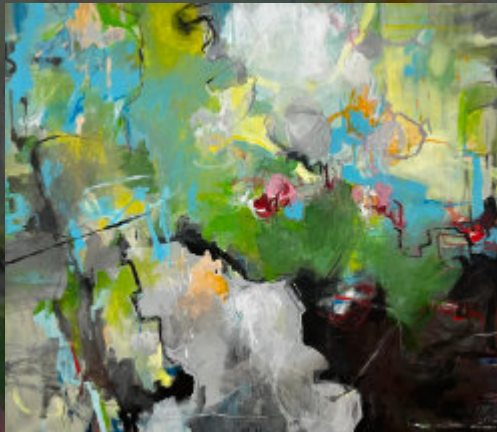
Annette Krämer, Ostwind 1, Acryl auf Leinwand