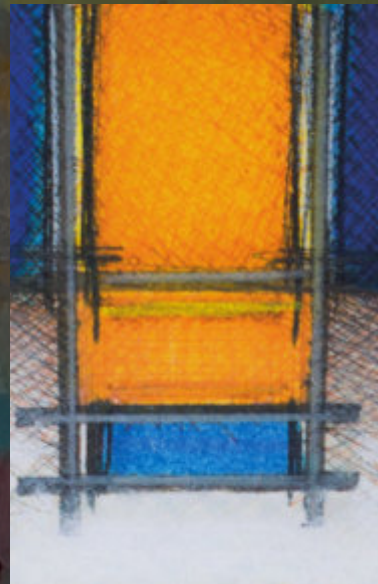
Jean Leyder, o.T., Mischtechnik auf Papier